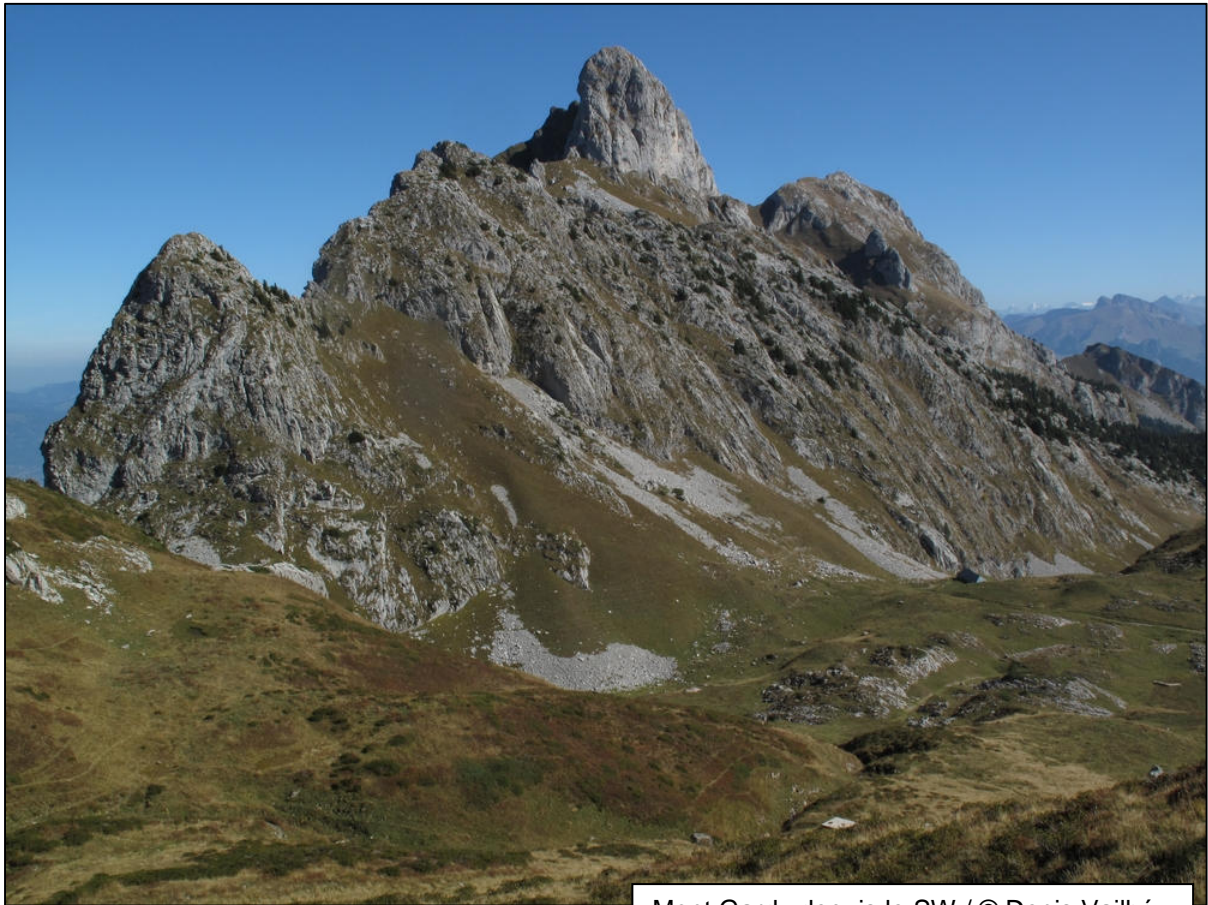
Mont Gardy depuis le SW